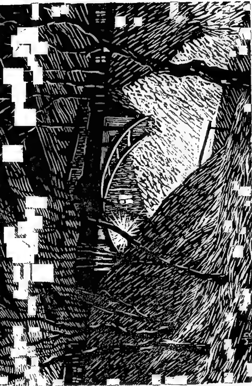
Sild Toomel, Linnoolüüge.